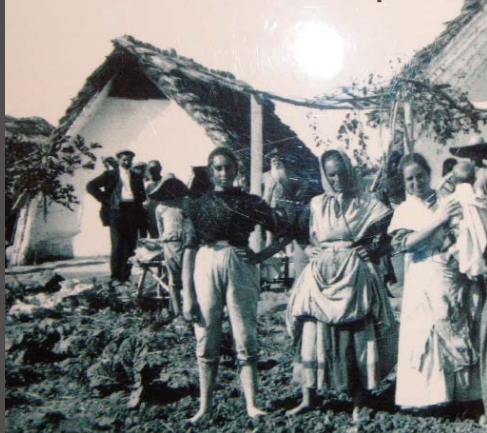
Centre d'interpretació Les Barraques