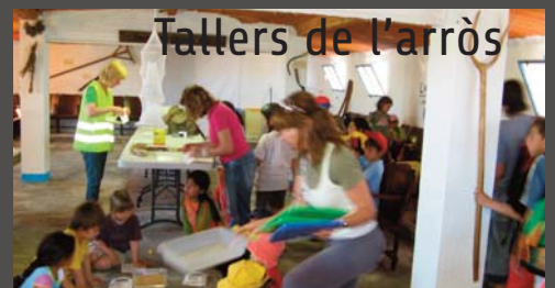
Tallers de l'arròs