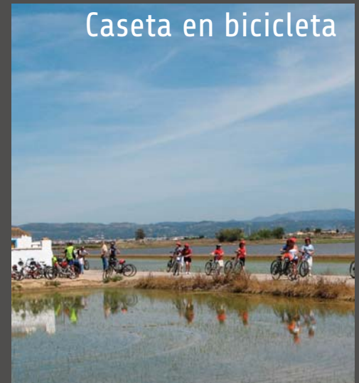
Caseta en bicicleta