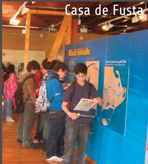
Casa de Fusta