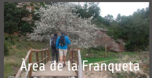
Àrea de la Franqueta