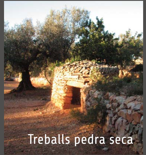
Treballs pedra seca