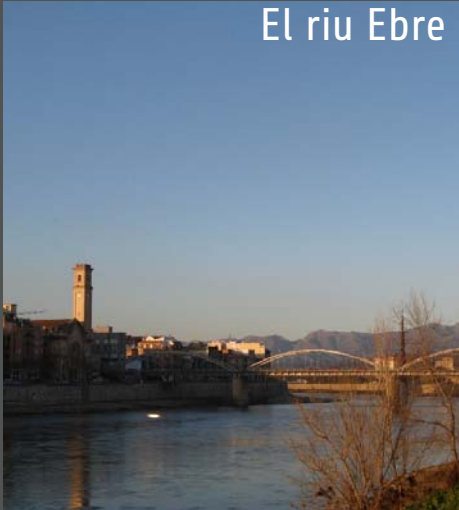
El riu Ebre