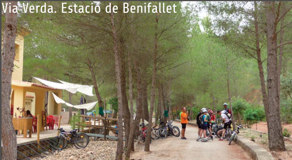
Via Verda. Estació de Benifallet