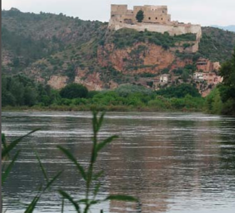
Castell i poble de Miravet